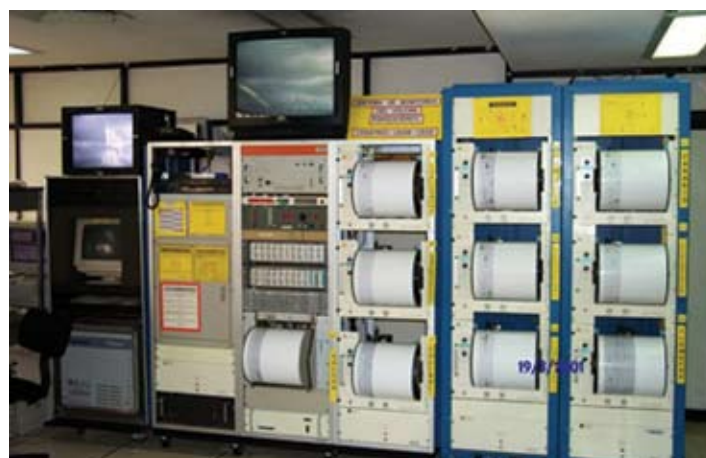
Laboratorio de instrumentación sísmica