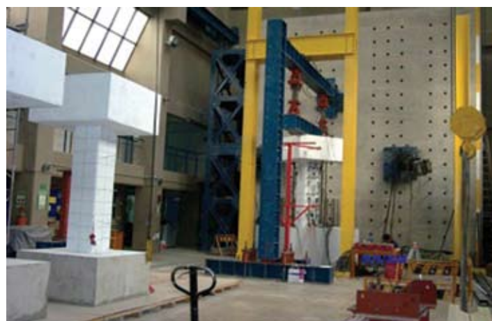
Laboratorio de estructuras grandes