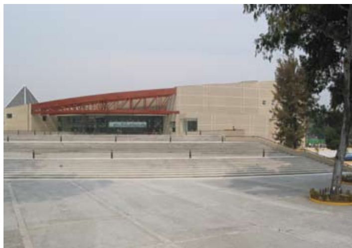
Instalaciones de la UPDCE (IPN)