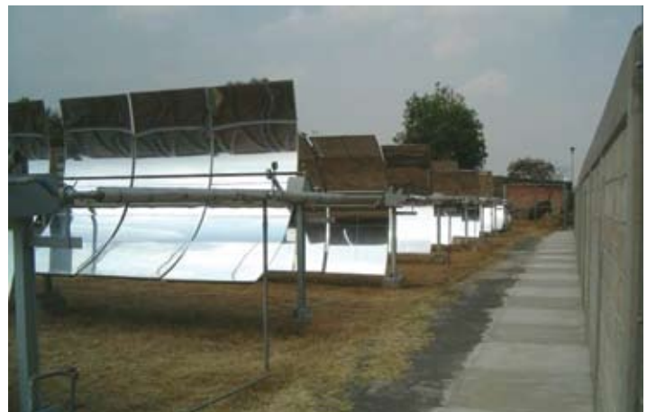
Ingeniería mecánica térmica y fluidos