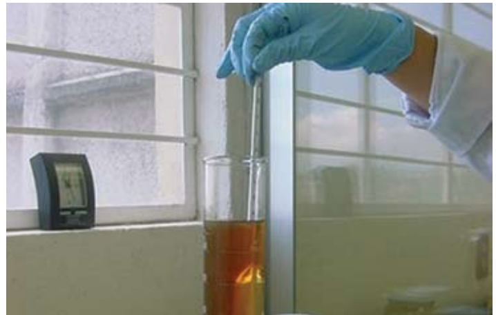
Prueba de densidad de combustibles destilados puros