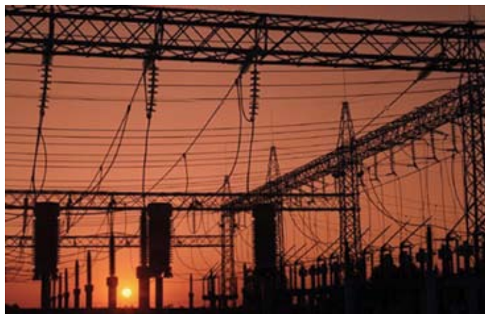
Subestación transmisión en los Azúfres, Michoacán