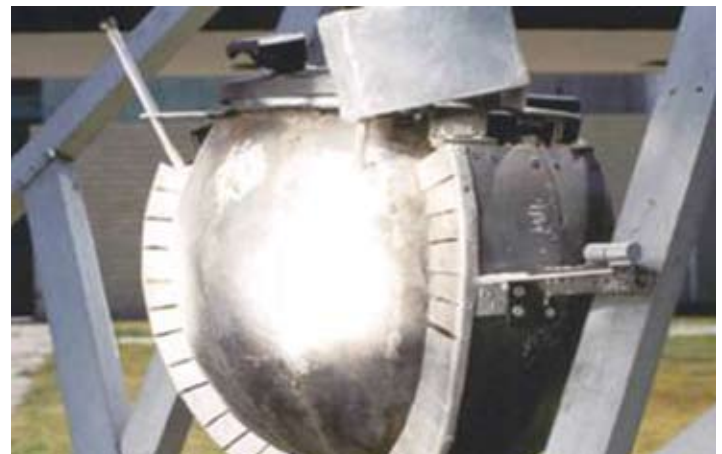
Concentrador energía solar