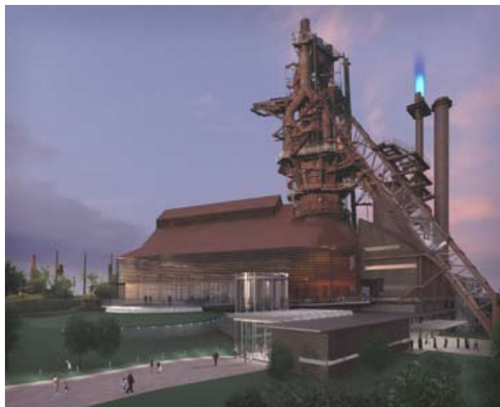
Museo del Acero, Monterrey, Nuevo León