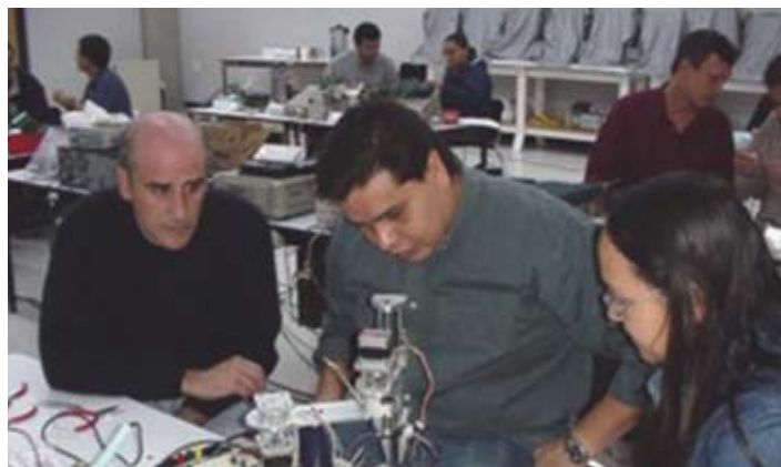
Profesores tomando clase de control automático, laboratorio de control del CNAD