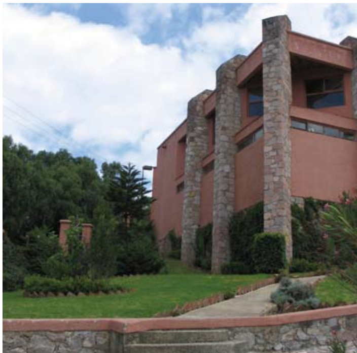
Biblioteca del CIMAT