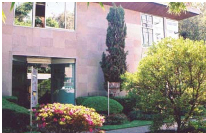
ANUIES, Ciudad de México