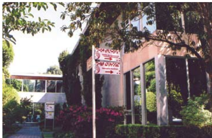
Edificio principal ANUIES