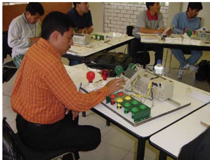
Curso de actualización docente