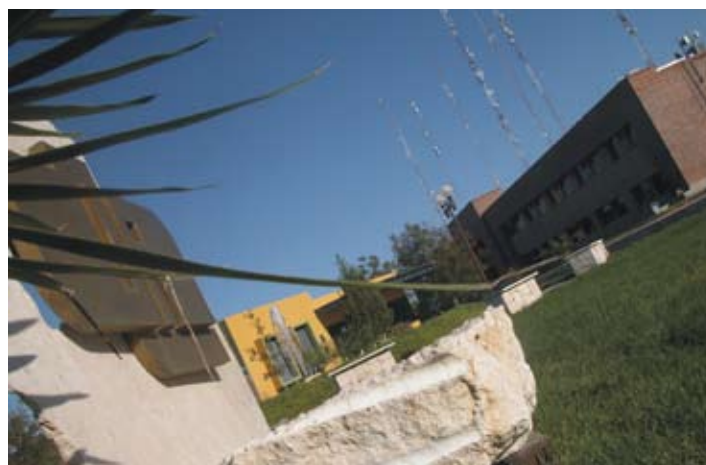
UAL, Torreón, Coahuila