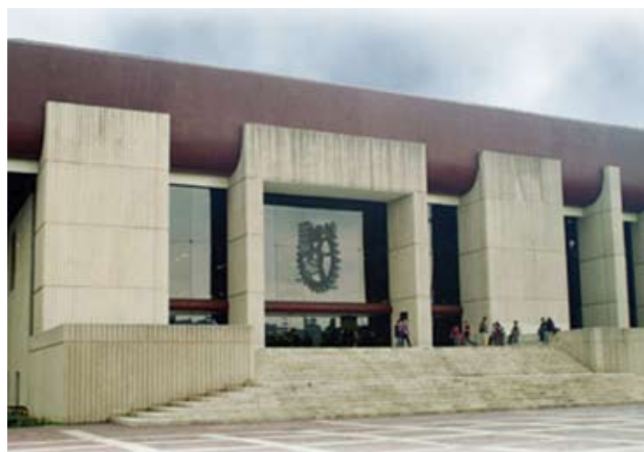
Biblioteca Nacional de Ciencia y Tecnología Miguel Bravo Ahuja