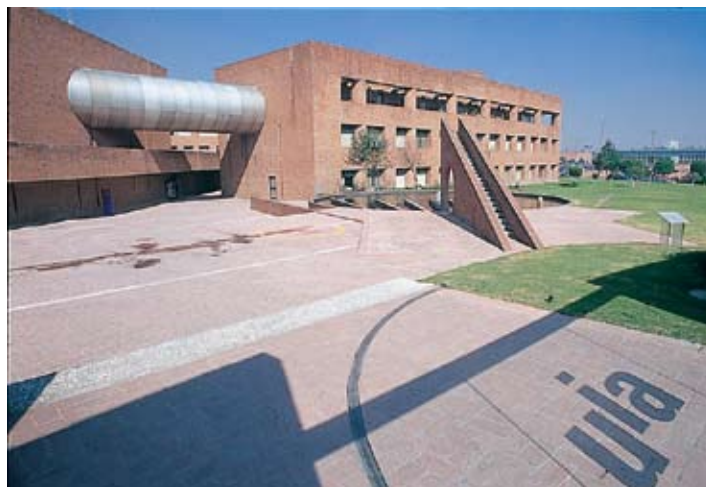
Instalaciones de la UIA, Ciudad de México