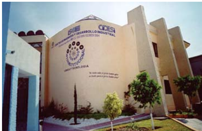
Edificio de posgrado del CIDESI