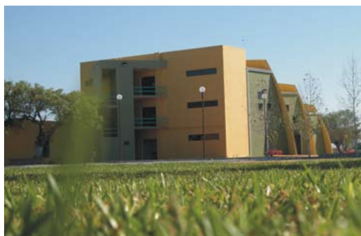
UAL, Centro de Investigación y de Posgrado