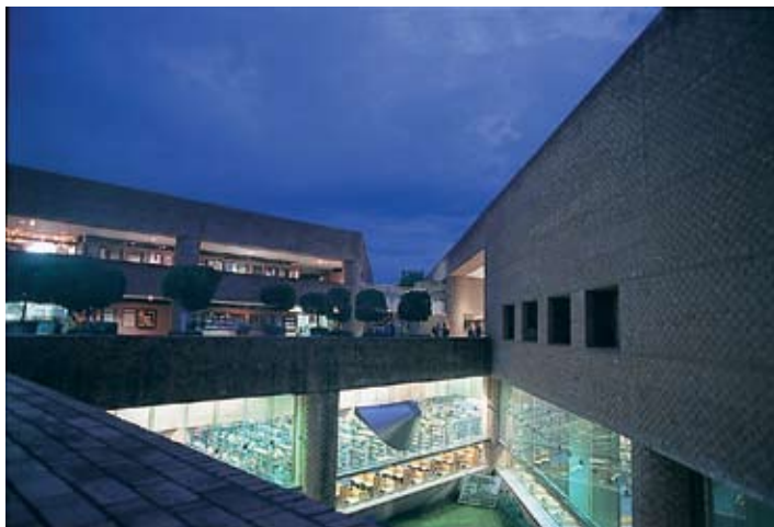
Vista nocturna de la biblioteca