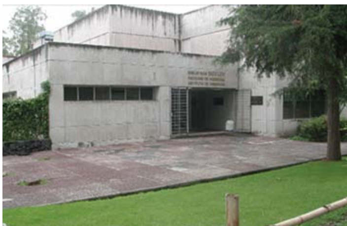
Biblioteca conjunta -Enzo Levi-, Facultad e Instituto de Ingeniería