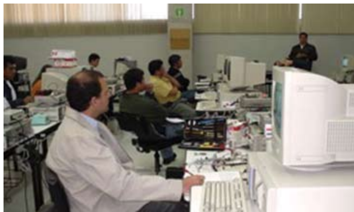
Alumnos del Diplomado de mecatrónica, laboratorio de electrónica del CNAD