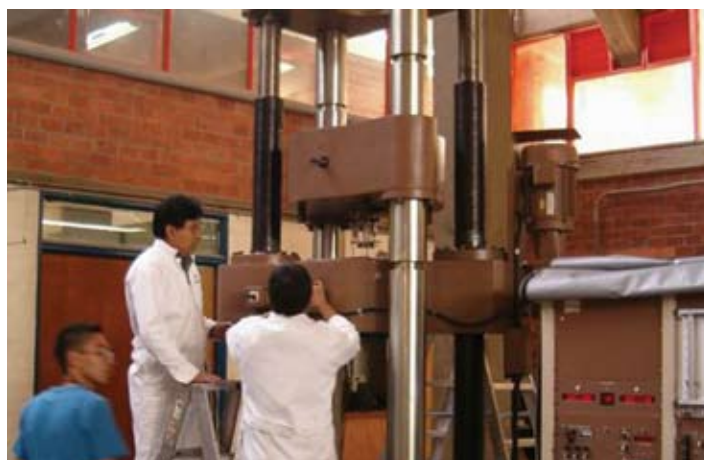
Laboratorio de estructuras