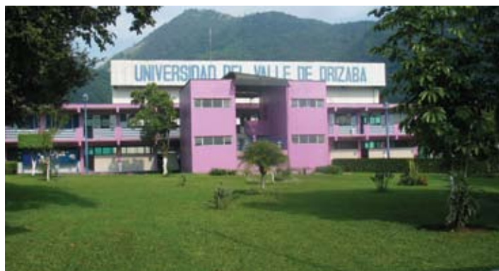
Instalaciones de la UnIVO