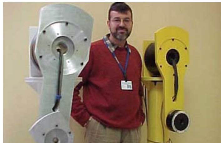
Laboratorio de robótica