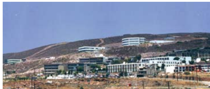
Instalaciones del CICESE