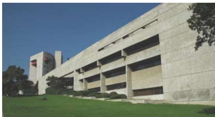
COLMEX, vista exterior