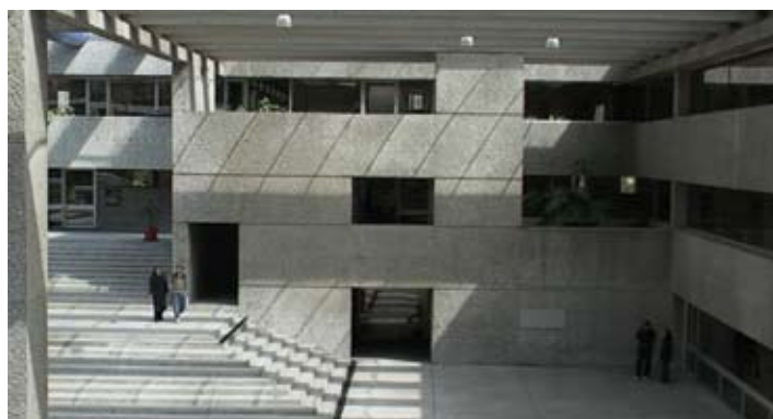
COLMEX, vista interior