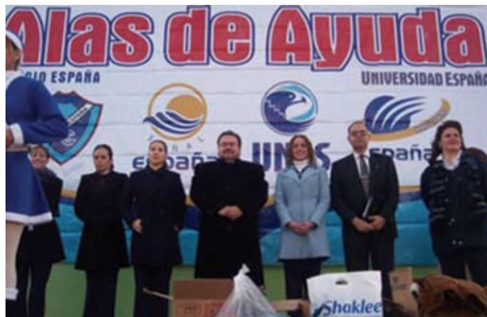
Evento Alas de Ayuda