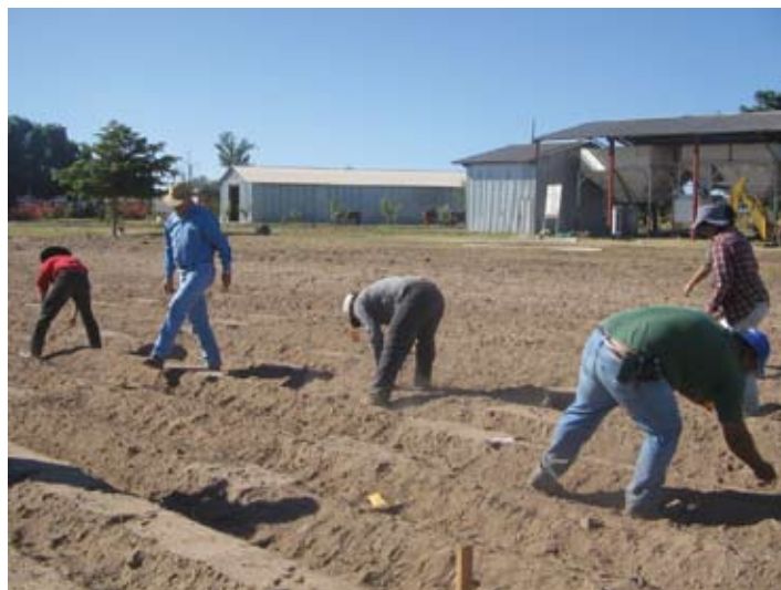
Trabajo en conjunto con las comunidades, CAPN