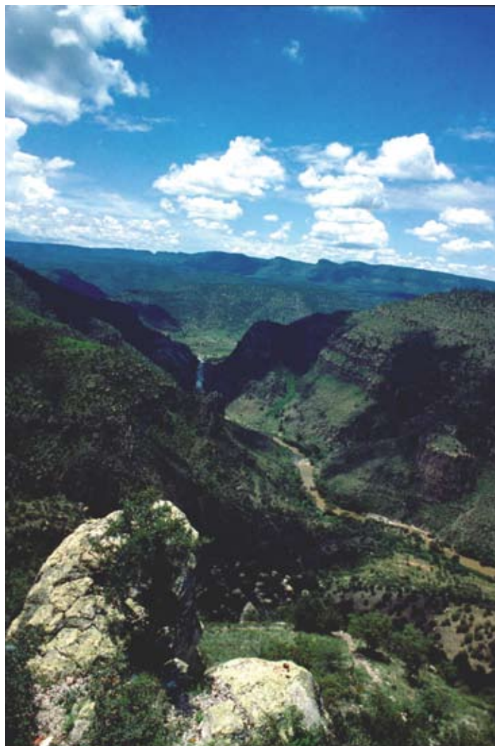
Vista de Cañones en la Sierra Madre Occidental en Durango.